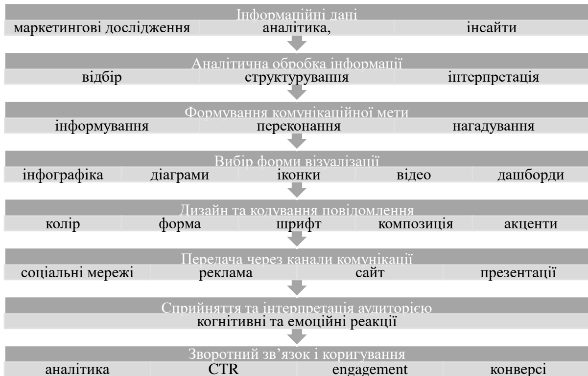
Рисунок 1 – Процес візуалізації інформації в маркетингових комунікаціях

На першому етапі формується інформаційна база, що включає результати маркетингових досліджень, дані ринкової аналітики, поведінкові інсайти споживачів та показники ефективності діяльності підприємства. Другий етап передбачає аналітичну обробку інформації, зокрема її відбір, узагальнення та інтерпретацію, що дозволяє виокремити ключові смисли, релевантні для цільової аудиторії. На третьому етапі визначається комунікаційна мета візуалізації – інформування, формування довіри, стимулювання попиту або підвищення впізнаваності бренду. Четвертий етап полягає у виборі адекватної форми візуалізації залежно від типу інформації та каналу комунікації (інфографіка, графіки, схеми, анімація, відеоконтент). П'ятий етап включає дизайн та візуальне кодування повідомлення з використанням кольору, форми, композиції та візуальних акцентів, що сприяє швидкому когнітивному опрацюванню інформації.