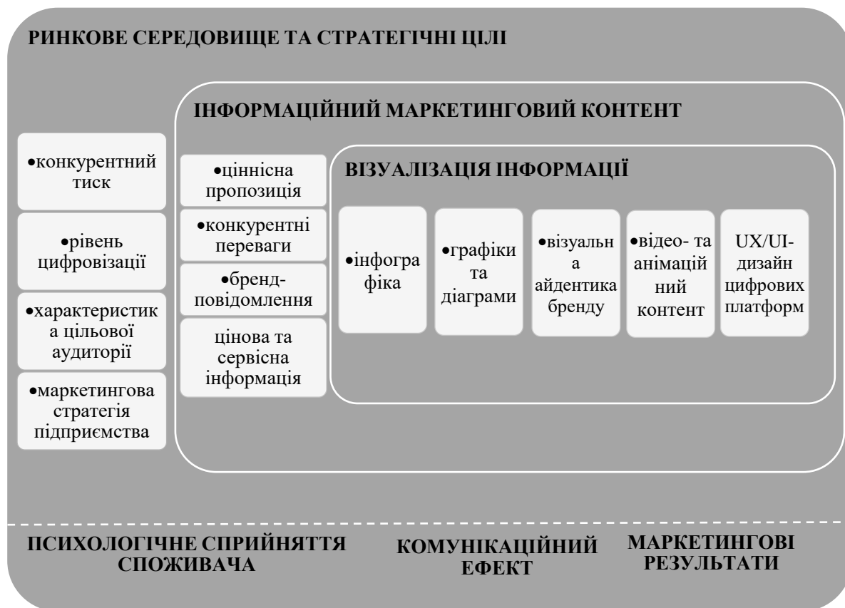
Рисунок 4 – Модель використання візуалізації інформації в маркетингових комунікаціях

покращення запам'ятованості повідомлення, формування позитивного бренд-образу та підвищення довіри до компанії.