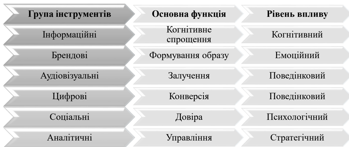
Рисунок 2 – Класифікація інструментів візуалізації в системі маркетингових комунікацій

Ураховуючи різноспрямованість маркетингової інформації та форм її представлення, варто визначити основні інструменти візуалізації даних, які використовують маркетологи (рис. 2).